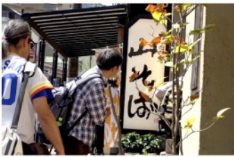
昼食におそば屋さんへ