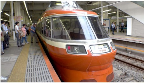
ロマンスカーでいざ出発