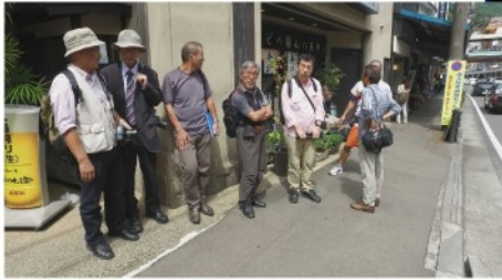
そば屋さんを出た店先で。 味は、いま〇〇だった。

100円バスでホテルへ 向かう。小回りの利いた このバスはすぐれもの。 到着後すぐに作業を行う。