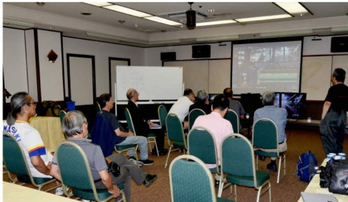
会議室で各映像の編集作業等を行う。